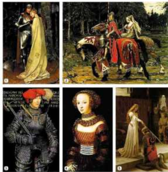
1 – Маріанна Спейтца. Дамка в білому. 2 – Альфонс Муза. Герцогиня Ліонська. 3 – Лукас Кранах Старший. Портрет Рахімо Дулово. 4 – Лукас Кранах Старший. Портрет бачока. 5 – Едмунд Лейман. Аноніма